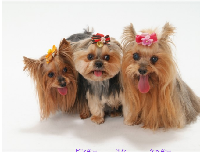
ピンキー はな クッキー